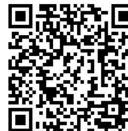
Profil zaufany na stronie ePUAP

Profil zaufany spełnia funkcje podobne do oferowanych obecnie, komercyjnych podpisów elektronicznych. Posługując się nazwą użytkownika ( login ), hasłem oraz adresem poczty elektronicznej od czerwca 2011 r. można załatwiać wiele spraw administracyjnych za pośrednictwem internetu (np. wnoszenie pism, wniosków i zapytań do urzędów). Profil zaufany to usługa dostępna bezpłatnie dla wszystkich obywateli, którzy założą konto na www.epuap.gov.pl .